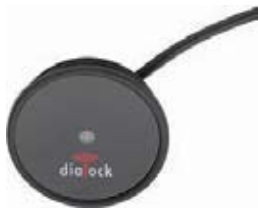
Diallock DFT Terminal para Muebles