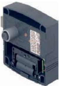
Diallock cerradura para locker