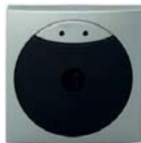
WT Terminal de Pared