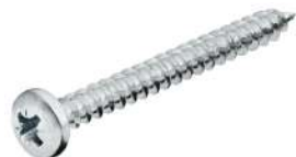
▪ Tornillo Ø4.5mm x 20mm PZ2