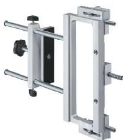
▪ Marco universal**

Para perforación avellanada de fijación a marco