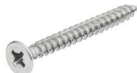
▪ Tornillo Ø4.5mm x 20mm PZ2

Para perforación oblonga de fijación a puerta.